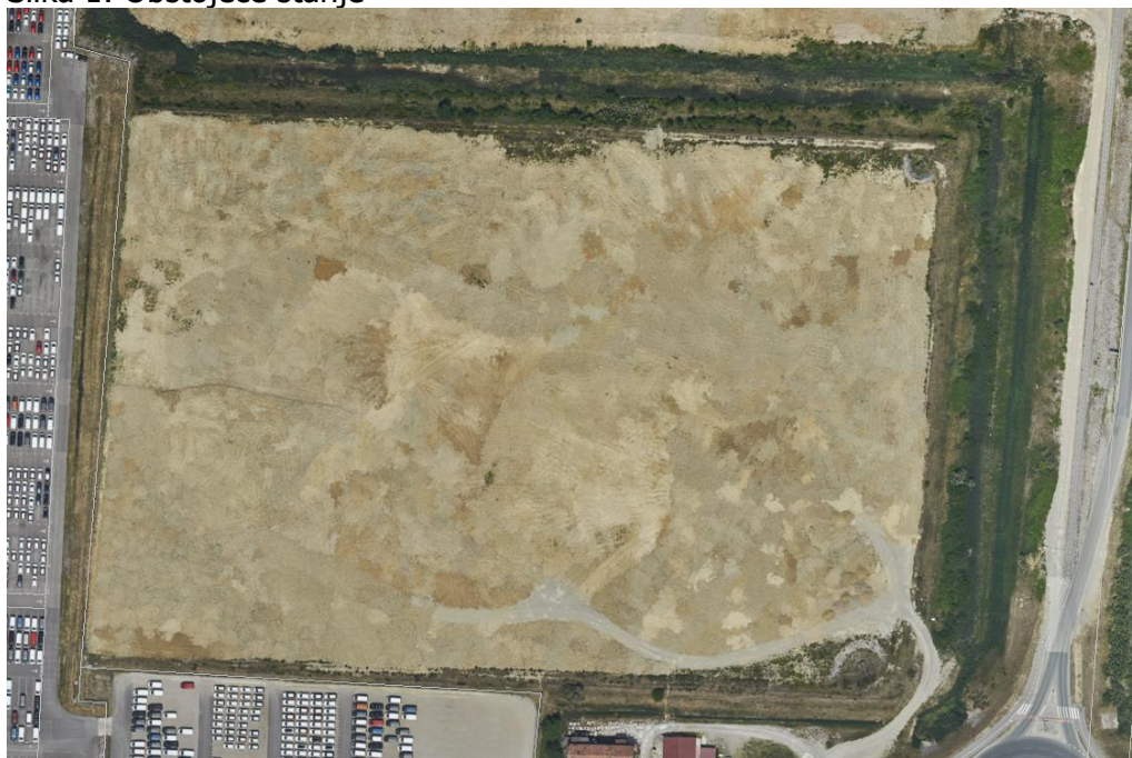
Slika 1: Obstoječe stanje

Kaseto obdajajo obodni nasipi, ki so zgrajeni na višinski koti +3,00 m n.v.. Na severnem, zahodnem in vzhodnem robu parkirišča se nahajajo obstoječi zemeljski jarki, ki odvajajo presežno meteorno vodo v smeri proti odvodniku. Na južni strani kasete je izvedeno obstoječe parkirišče za skladiščenje vozil. Parkirišče se nahaja tudi na zahodni strani obravnavanega območja, le da je v tem primeru slednje ločeno od kasete z odvodnim jarkom. Površina kasete je porasla z redkim grmičevjem in travno rušo. Odvodni jarki so večinoma porasli z grmičevjem. Na območju ni obstoječe komunalne infrastrukture.